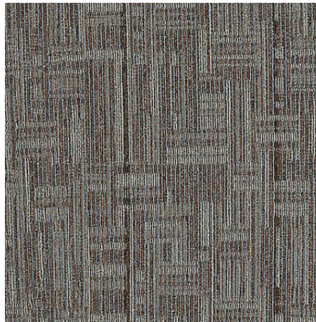
QA194-828 VIRAL REALITY