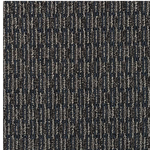
RIVER LANDING 599