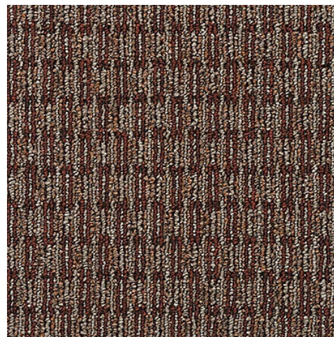
CHELSEA MARK 383