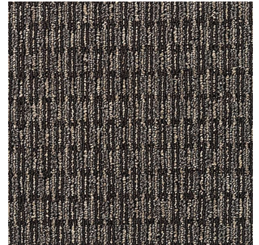
HISTORICAL ROW 997