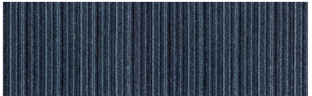
575 GRIS CLARO