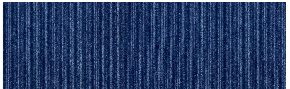
485 AZUL LAPIZ