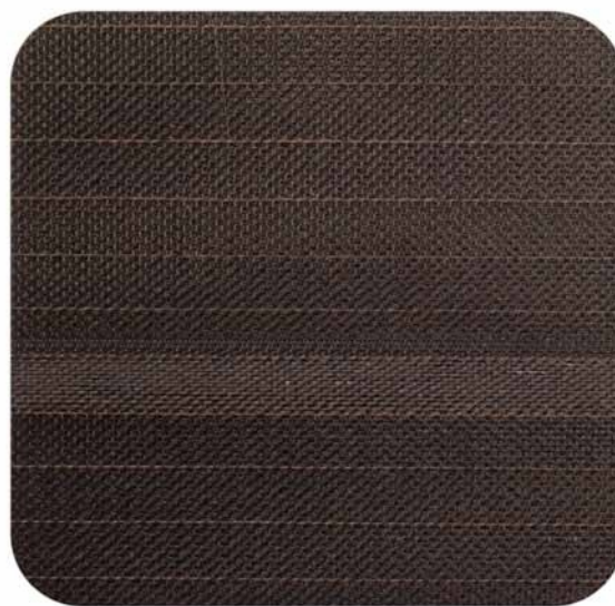
Chocolate | 814