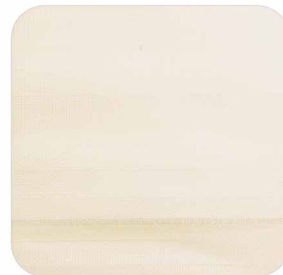
Crema | 115