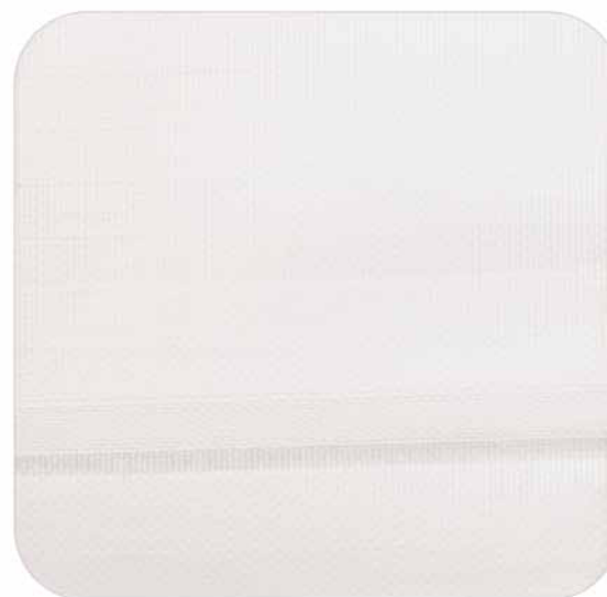
Blanco | 900